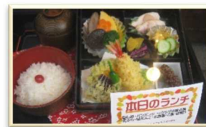
昼食のイメージ テーブル席でゆっくりと・・・