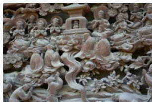
「帝釈天彫刻ギャラリー」の彫刻は一見の価値大いにあり