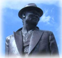
柴又駅前の「お兄ちゃん」