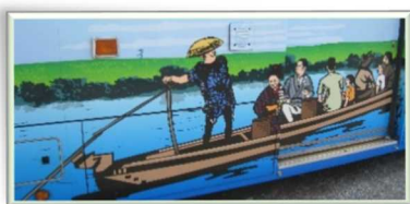
京成バスボディーペイントより